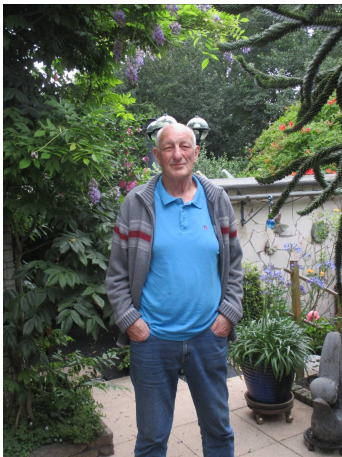
Cor in de tuin

Door interviews kunnen we de mensen van onze club beter leren kennen.