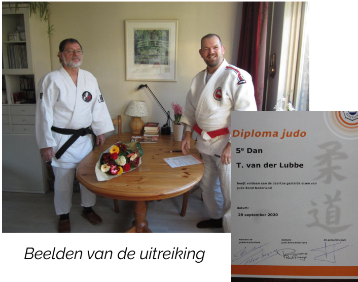
Beelden van de uitreiking