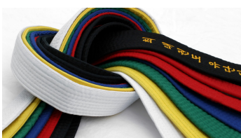
Banden in allerlei kleuren

Twee keer per jaar zijn er judo-examens in De Mussen. Telkens als je een examen haalt, krijg je een band met een andere kleur.